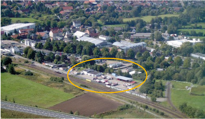
Unser Flüssiggaslager Braunschweig