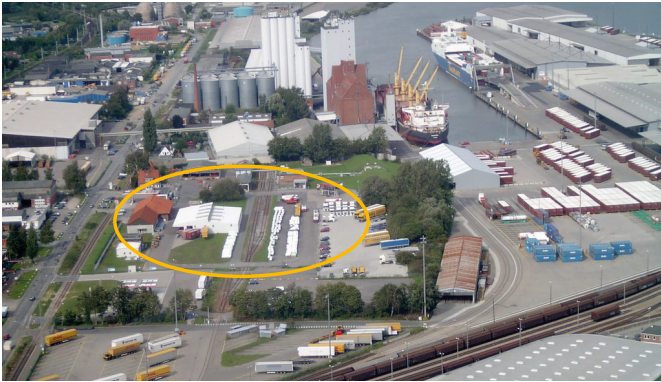
Unser Flüssiggaslager Lübeck