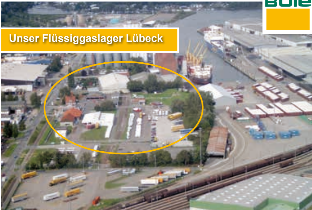
Unser Flüssiggaslager Lübeck