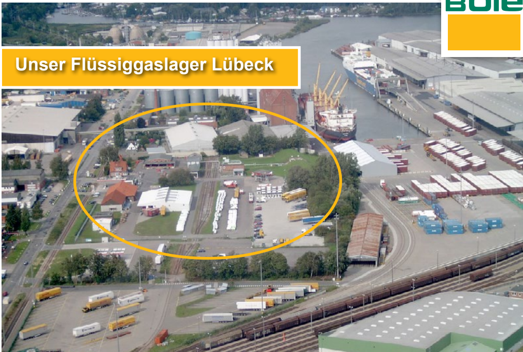
Unser Flüssiggaslager Lübeck