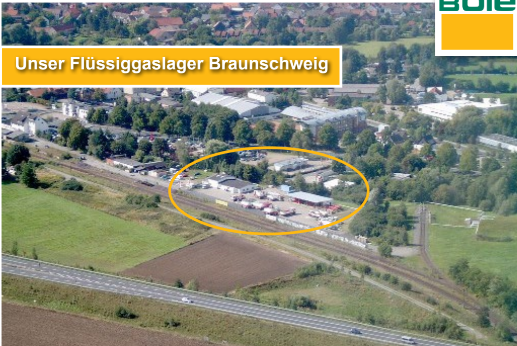
Unser Flüssiggaslager Braunschweig

Sehr geehrte Nachbarn, Sicherheit genießt bei uns die höchste Priorität. Neben den ergriffenen Maßnahmen zur Sicherheit schreibt die Störfall-Verordnung eine Information der Nachbarschaft vor. Diese Broschüre soll dazu dienen, Sie zu informieren, wie man sich verhält,